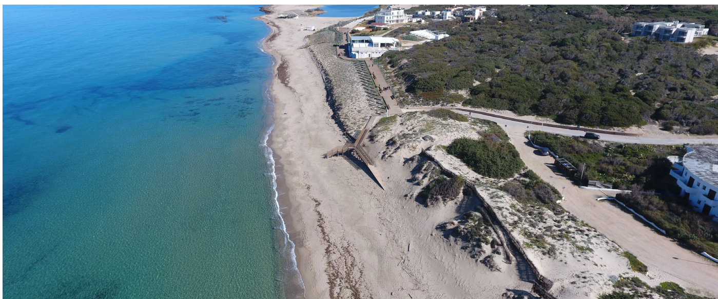
LA SPIAGGIA DI MARAGNANI (VALLEDORIA)